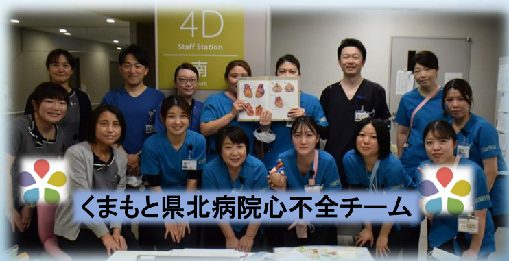
くまもと県北病院心不全チーム